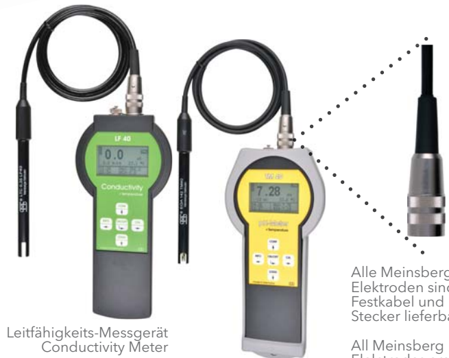
Leitfähigkeits-Messgerät Conductivity Meter