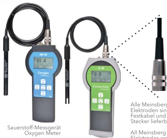
Sauerstoff-Messgerät Oxygen Meter